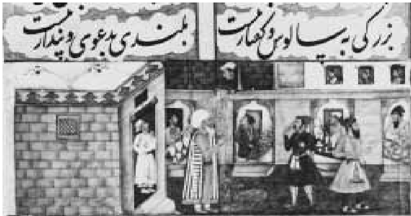
El vecino vertiendo cenizas sobre la cabeza de Bāyazid

Cuentan que el maestro Bāyazid, en su viaje de peregrinación a La Meca, llegó a un pozo en el desierto, donde un grupo de gente se amontonaba para beber agua. A pocos metros del pozo vio a un perro sediento sentado en un rincón. El maestro gritó: «¡Oh gente! ¿Existe alguien entre vosotros que me