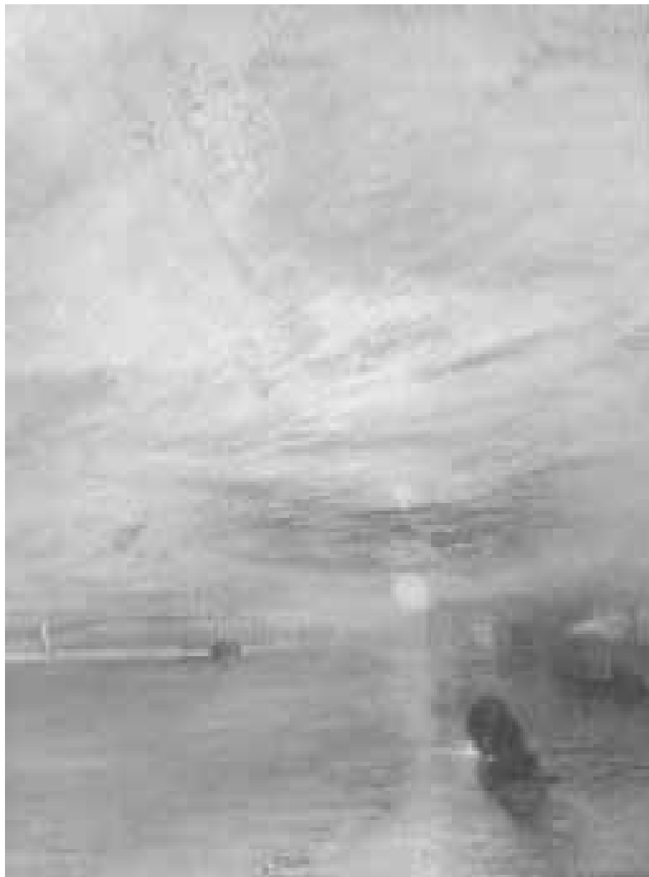
Detalle de «El Temerario», de Turner.

Cuando cada día empezó a no mostrarse mejor ni diferente del anterior, cayó sobre ellos un tedio que embotaba el intento, una lasitud que a algunos les hizo temer que el acto