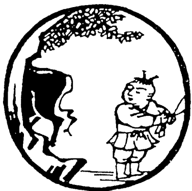
[第三图] 卅 3

De esta forma -es el tercer cuadro- descubre, o redescubre, al buey, nada más un poco por atrás, pero es el buey. «Trina un ruiseñor en la enramada, fulgura el sol en las salcedas ondulantes ¡ahí está el buey! ¿Dónde iba a poder esconderse? ¿Qué artista sería capaz de retratar esa espléndida testuz, esos majestuosos cuernos?» Es imposible expresarlo. Esto es un primer momento