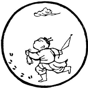
[第二图] 廿 2

En el segundo cuadro, el pastor descubre las huellas del buey. «Ha visto innumerables pisadas en el bosque y a orillas del agua... Nada logra ocultar la nariz de este buey que llega hasta el mismo cielo». En realidad nada lo puede ocultar, es evidente. El pastor empieza remotamente a darse cuenta al descubrir sus pistas a través de personas, acontecimientos, enseñanzas que le van orientando; persigue el camino que le marcan, en este caso practica Zen.