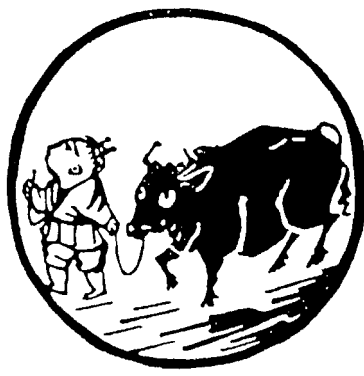
[第五图] 卅 5

En el siguiente: «Tiene que tirar de la creata, para que el buey no se le escape, porque puede perderse en los fangosos tremedales». Ocurre como dice San Juan de la Cruz con otra imagen: cuanto más se arrima el leño al fuego, más empieza a sudar y respingar, sale a relucir toda la humedad que antes ni se