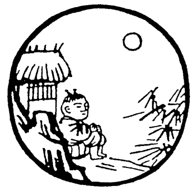
[第七图] 卅 7

El poema del séptimo cuadro dice: «Solo, a lomos del buey logró volver