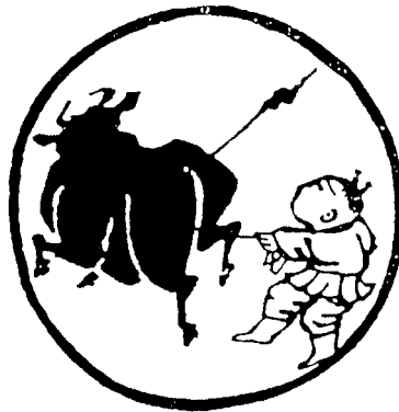
[第四图] 卅 4

En los siguientes, desde el cuarto al séptimo, se refleja el proceso de transformación que va teniendo lugar a partir de este momento. Es decisivo para que el proceso avance, llegar a atar al buey, una disciplina, de lo contrario se vuelve a escapar. «Tiene que atarlo corto y no soltarlo, porque el buey es arisco todavía, ya arremete contra las cumbres, ya se refocila en brumoso desfiladero».