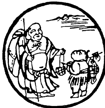
[第十圖] 卍 10

Este último cuadro, el décimo, es muy importante y característico del Zen, que ha surgido en el ámbito del Budismo Mahayana, cuyo ideal es el bodisatva. Este, desde la experiencia de la unidad con todos, percibe el dolor de los demás como suyo propio y desde ahí libera, salva. Zen es experiencia del vacío, de lo que no cae en sentido, y es compasión. Esto se ve en el último cuadro, cuyo poema reza: «Desnudo el pecho y descalzo entra el hombre en el mercado.