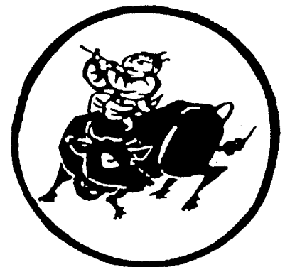
[第六图] 卅 6

En el sexto llega a soltar las riendas y está sentado libre tocando una flauta. Es un cuadro, ya no de lucha sino de alegría y paz. «Cabalga libre como el aire... Donde quiera que vaya levanta una brisa fresca, mientras en su corazón reina una honda tranquilidad. ¡Este buey no necesita un solo tallo de hierba!» Sobran todas las palabras. Pero aún sigue habiendo dos, pastor y buey.