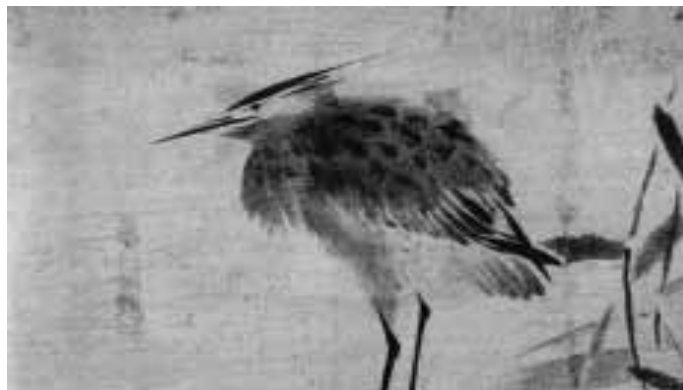
Garza real. Museo nacional de Tokio