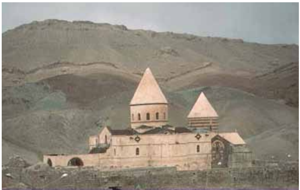
Iglesia de San Tadeo (Macu, Persia)

Marcela, que vivió a finales del siglo IV y principios del V, pertenecía a una de las familias nobles de Roma. Huérfana de padre desde pequeña se quedó viuda a los seis meses de su matrimonio y declinó con elegancia las propuestas de un nuevo matrimonio por parte de un cónsul romano. Repartió a los pobres la mayor parte de sus riquezas y vivió en su casa del Aventino junto con su madre y un grupo de nobles romanas, convirtiéndola en un lugar de oración donde se reunían con una triple finalidad: orar, leer los salmos y comentar las Escrituras. Como el comentario de las Escrituras exigía una interpretación, ellas iban anotando los problemas que surgían para luego poder consultar. Se cuenta que san Jerónimo, el que escribe luego la Vulgata, la traducción al latín de los escritos griegos de la Biblia, llega a Roma y se queda totalmente fascinado por la cantidad de grupos inteligentes, cultos, de mujeres que se reunían únicamente para rezar y comentar la Escritura. Marcela lo toma como maestro y cuando éste abandona Roma, Marcela se convierte en la autoridad de referencia para la interpretación