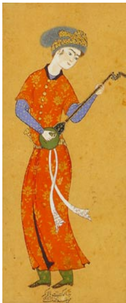
Joven músico. Miniatura persa, s. XVI

Sin embargo, el sufismo no solamente ha sido un manantial para la música clásica en tierras islámicas, ha enriquecido también la tradición popular incorporando poesías compuestas en lenguas vernáculas y adaptadas a melodías populares en sus expresiones más conocidas. Un ejemplo de ello es la «estrofa de cuatro versos de tradición turca, en la cual los tres primeros versos riman, y la rima del cuarto se extiende a lo largo de todo el poema... Los metros populares turcos utilizan el cómputo de sílabas; no son cuantitativos como en la tradición literaria