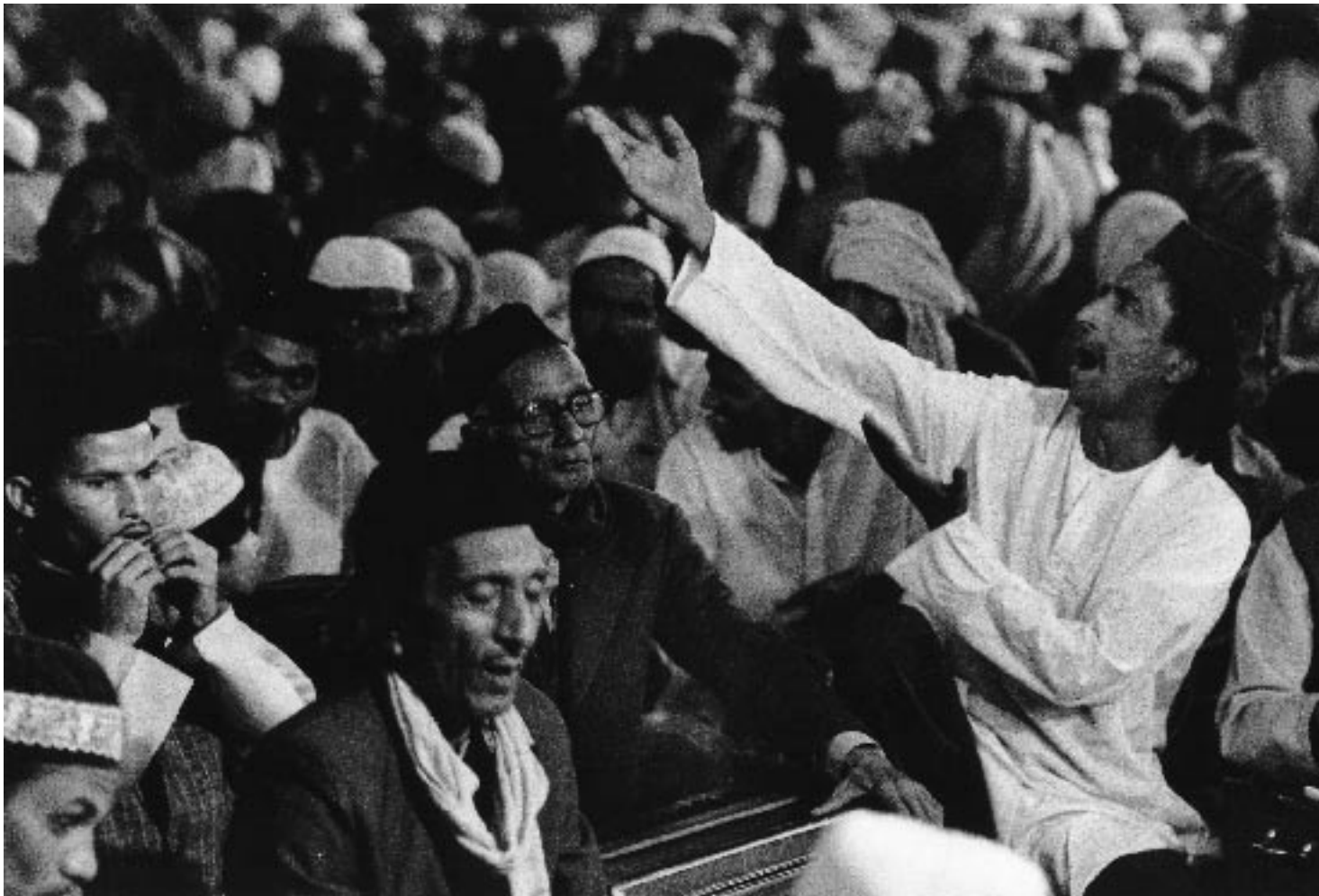
Músicos ( qanwālis ) sufíes en el mausoleo del santo sufi Mo'īnuddīn Ajmeri en India

Una gran parte de la India, así como de Indonesia y del África Sub-sahariana fue islamizada por sufíes que adaptaron las tradiciones musicales locales a su poesía y a sus enseñanzas, de tal forma que canciones en honor del Profeta, de 'Alí y de los wālis (amigos de Dios, santos) han llegado a formar parte de las canciones