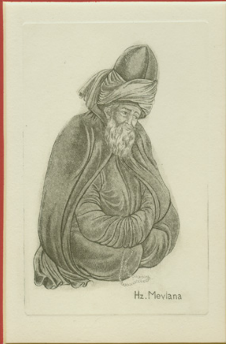
RETRATO DE MAWLANA RUMI