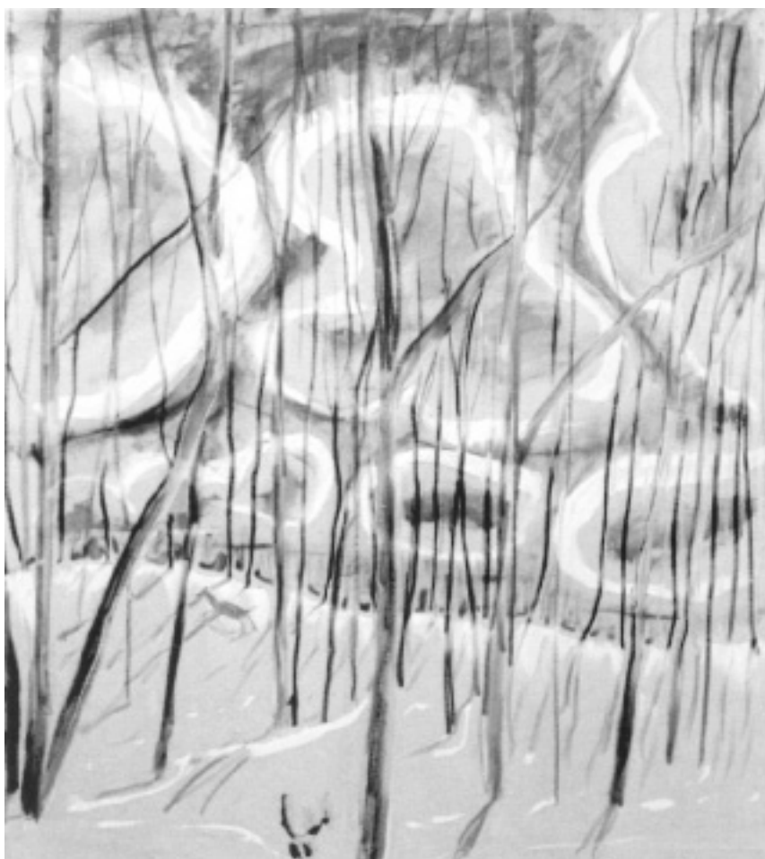
La gloria de las nubes a través de los árboles, 1973, Wallace Putnam. Cortesía de la Fundación Putnam

lado derecho de su cuello, los hombros sobresaltándose, el brazo derecho extendido, el pincel sujeto en la punta de sus dedos, bailaba hacia adelante y hacia atrás, y las imágenes eran lanzadas sin esfuerzo de su cerebro a su brazo, y de éste al lienzo. El movimiento era como un ballet, y el giro certero y leve de su muñeca daba origen a las más hermosas pin-